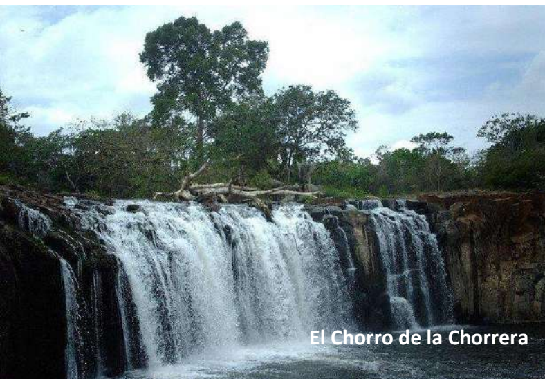
El Chorro de la Chorrera