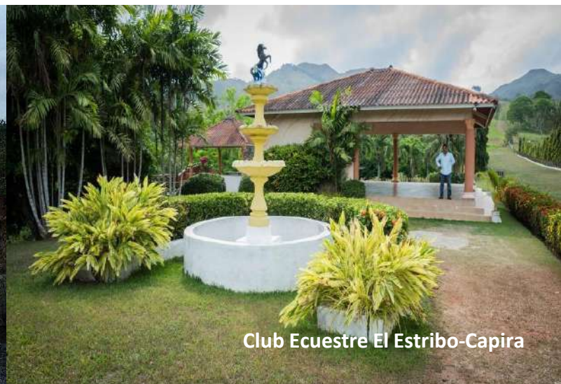
Club Ecuestre El Estribo-Capira